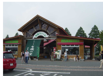
富士ミルクランドまで1.8km