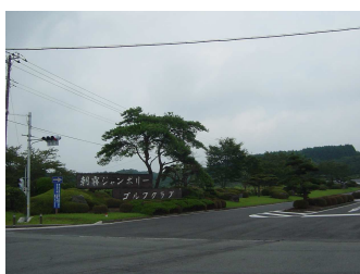
朝霧ジャンボリーGOまで2.5km