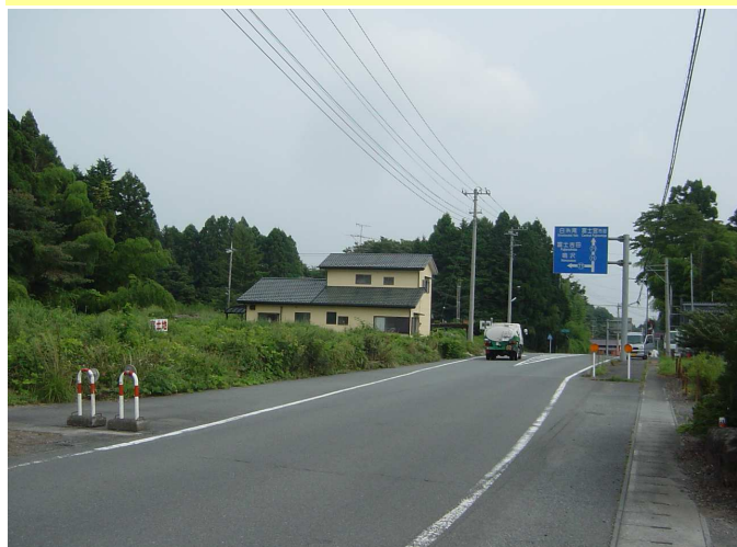
当地付近 手前が北方向、当地西側が県道75号(甲府・本栖方面)に接している。 前方は白糸の滝、富士宮市へ;左折は富士吉田へ